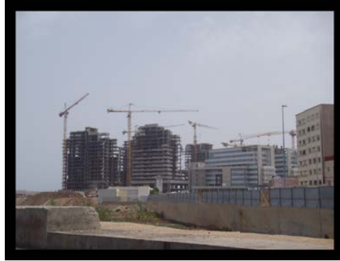
Casablanca : Sa grande mosquée, ses travaux...

traverse un paysage désertique. Pas de doute, nous sommes en Afrique ! Germain, qui s'était convaincu qu'il ne pourrait définitivement jamais dormir dans les transports, s'offre un contre-exemple en s'endormant presque en sursaut, malgré – ou bien à cause ? – des soubresauts du train.