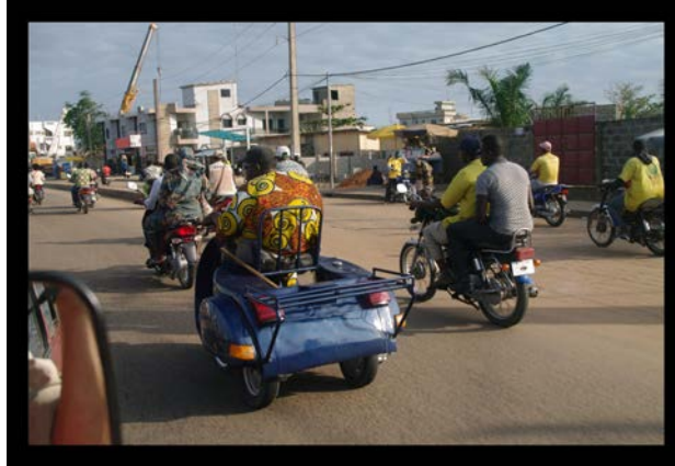
Place de l'Etoile à Cotonou

un intéressant assemblage de parpaing et de béton plus ou moins ouvragé selon les endroits. En guise de fenêtres, des ouvertures rectangulaires dans les murs, et en guise de plancher, de la terre battue. Chambres tout inclus, avec douche, toilettes, sol carrelé, et... intrus rampant à pattes. Il y a même un ventilateur, mais qui doit brasser l'air jusqu'à environ 20 cm des pales tant il tourne lentement... C'est fâcheux, car la moiteur de l'air commence à se faire sentir lourdement. Nous arrivons tant bien que mal à tendre un fil à travers la chambre pour soutenir la moustiquaire, mais le montage n'est pas très au point et tient plus du filet de pêche (au gros) à la dérive que du campement militaire. Pour l'instant, on s'en contentera. Dodo.