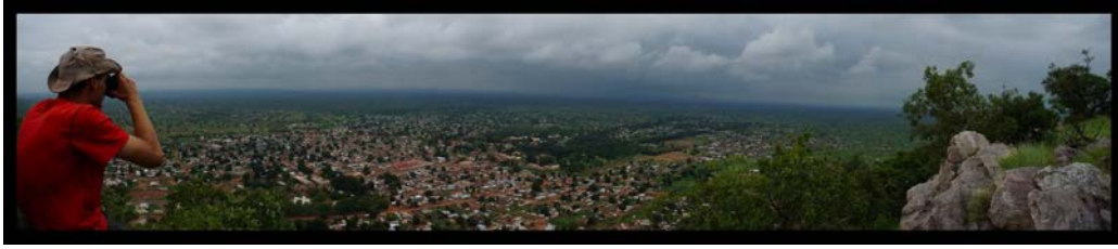
Tanguièta, d'en haut.