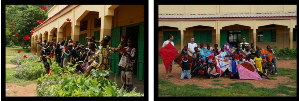
Les débuts de l'aéronautique béninoise.

retouches chez le tailleur, ils ont finalement pu être livrés, pour des usages variés : de la robe décontractée au... pyjama !