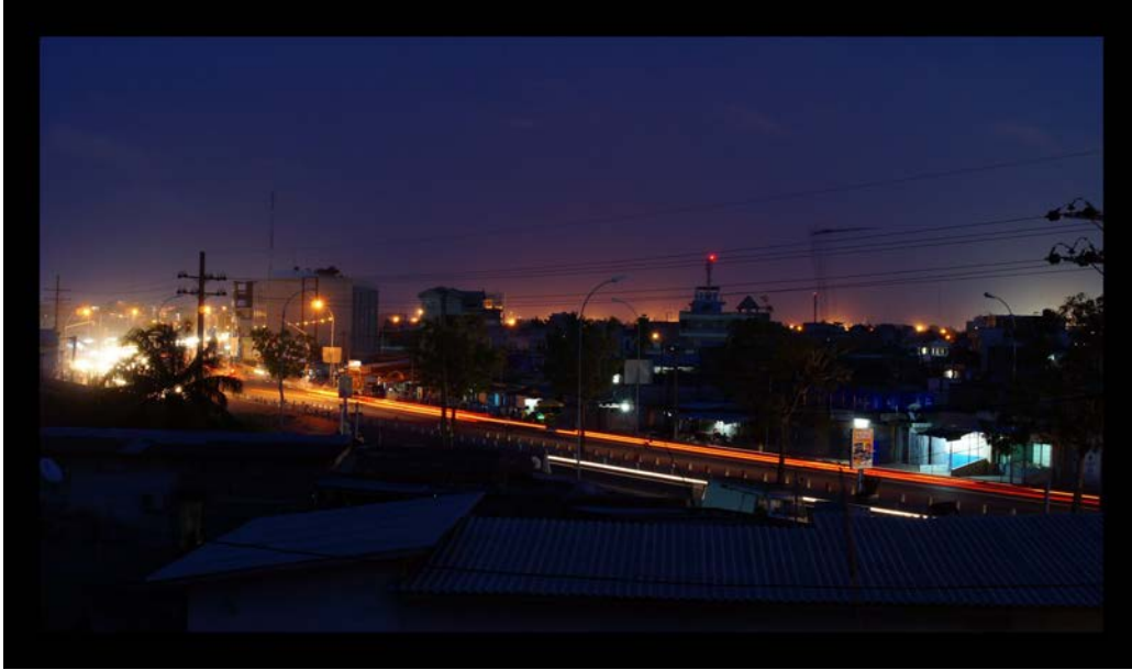
Cotonou, la nuit, depuis l'hôtel