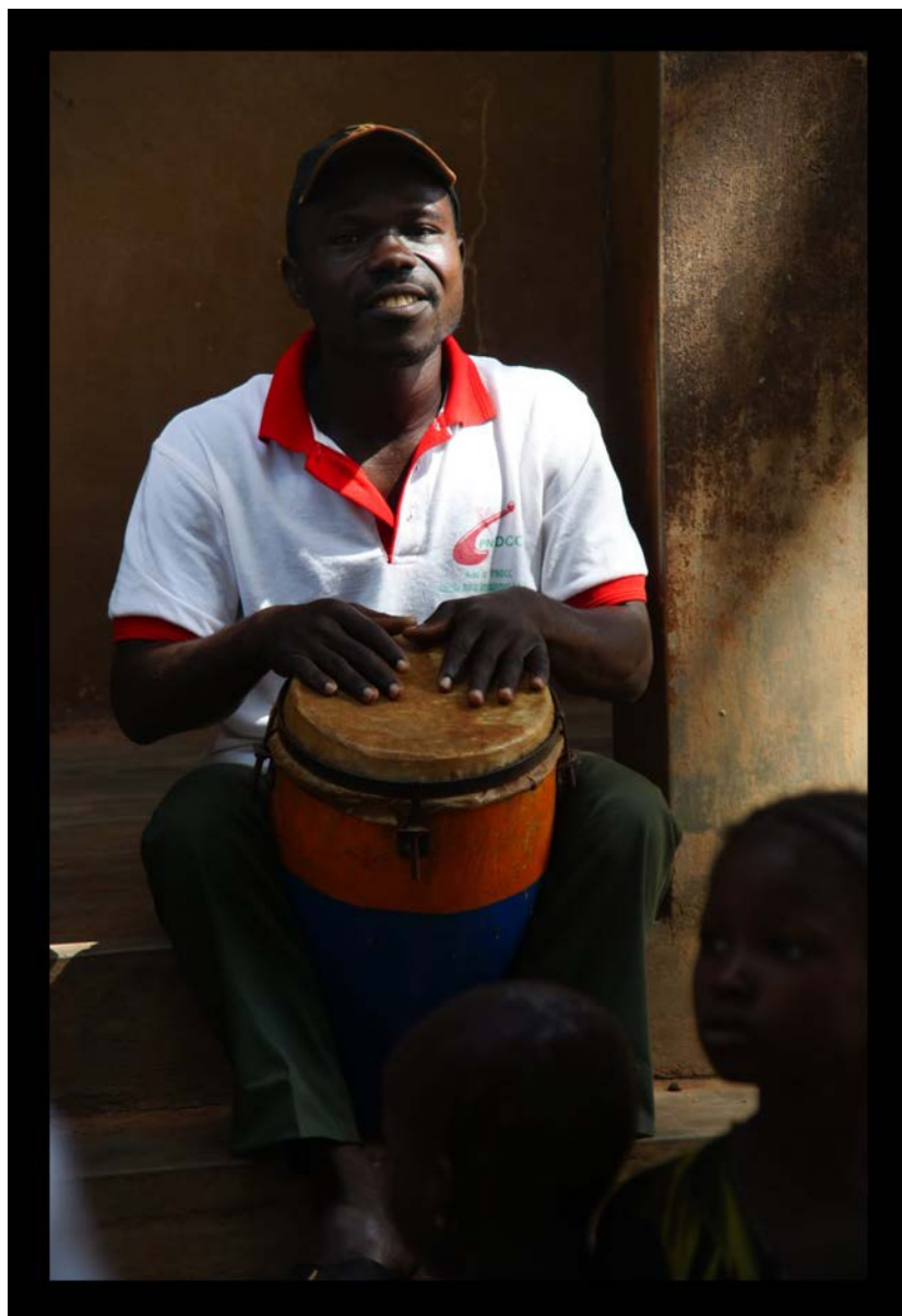
Le spectacle de l'après-midi.