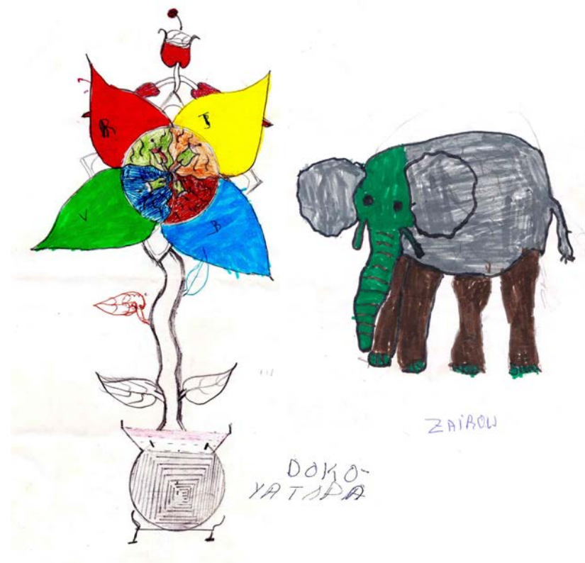
Deux des dessins de l'après-midi.