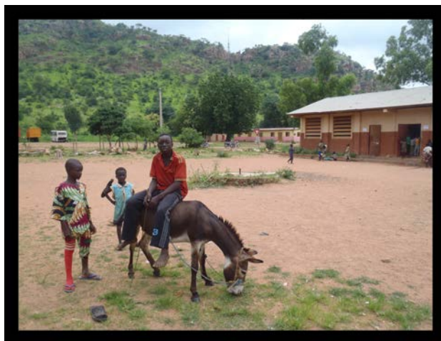
Le complexe scolaire primaire de Tanguietà

à l'école, le transit étant assuré par un minibus dans lequel, une fois n'est pas coutume, on s'empile tant bien que mal. Cette fois, les bagages sont sur le toit et daigneront même y rester pendant tout le trajet, bien que nous ayons quasiment doublé la hauteur du minibus. Nous découvrons notre futur lieu de travail. L'école est en bordure de la ville, quasiment à flanc de colline, et se compose de plusieurs bâtiments rectangulaires en dur, recouverts chacun d'un toit en tôle. Le toit de l'un d'entre eux est d'ailleurs éventré, conséquence d'une tempête ayant sévi en début d'année. Le terrain de l'école n'est pas vraiment physiquement délimité, j'espère qu'on n'aura pas trop à courir après nos futurs élèves... En tout cas il y a de la place, au moins deux grands espaces pourront servir de terrain de jeux l'après-midi, et un stade – circulaire ! de foot en terre battue est implanté un peu plus loin. Nos grands-parents auraient pu fréquenter les salles de classe : les élèves seront installés sur de bons vieux pupitres ! Les tableaux ne sont pas de première qualité, mais on s'en contentera. Je n'aurai tout de même jamais usé aussi rapidement des craies, à la fin du séjour nous en étions un peu à court.