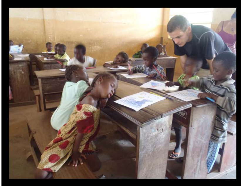
Scène de classe chez les CI. Il y en a quelques-uns qui n'ont pas l'air de suivre, monsieur le professeur !