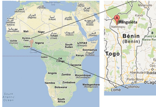
Situation géographique du Bénin, et localisation de Tanguieta