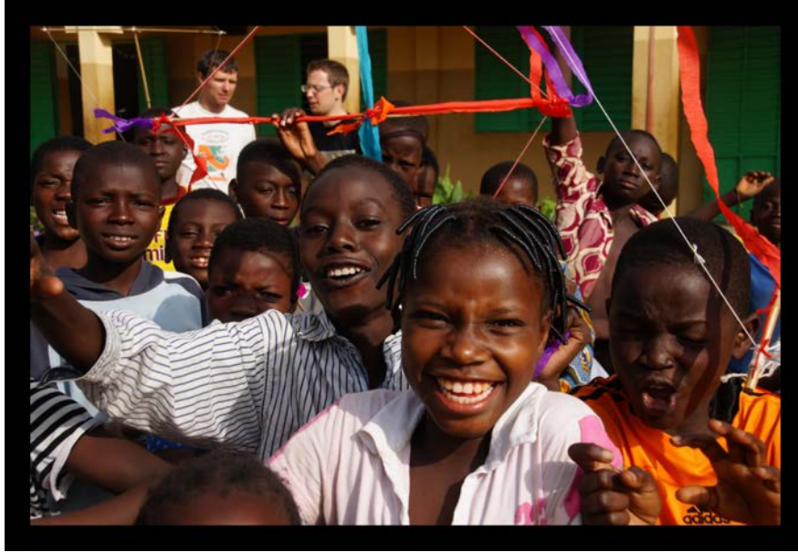
Les élèves et les beaux cerf-volants en cours de fabrication. Derrière, les (non moins beaux) profs.

L'après-midi, les bambous de Nicolas vont servir : nous commençons un atelier cerf-volants. Cette fois, ils sont sacrément plus dégourdis que le matin ! Lorsqu'on leur demande de faire tenir les deux bras en croix avec de la ficelle, ils font cela mieux qu'on aurait nous-même pu le faire ! Nous les avons mis par groupe de cinq élèves, et ils décident spontanément de mutualiser leurs efforts, pendant que l'un tient les ciseaux, un autre tient le fil et les trois autres le cadre. Ma grande crainte du moment, c'est qu'une tige de bambou arrive pile dans l'oeil de quelqu'un, heureusement tout se passe bien, et les petits passent vite à la décoration de leurs engins à grand renforts de papier-crépon et de brins de laine. Finalement, leurs cerf-volants sont très réussis, nous sortons prendre une photo de tout le groupe.