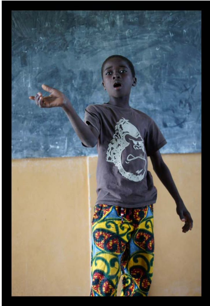
Un grand orateur.