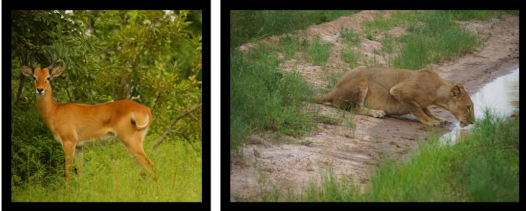
Quelques beaux exemplaires de la faune ouest-africaine.